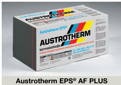
Austrotherm EPS® AF PLUS

Termoizolaciona ploča Austrotherm EPS® AF PLUS predstavlja najkvalitetniju varijantu termičke izolacije fasade objekta. To je ploča na bazi EPS-a („stiropora“) koja je obogaćena primesama grafita , a one ploči daju ne samo karakterističnu sivu boju, već i što je mnogo bitnije - i do 20% bolja termoizolaciona svojstva u odnosu na ekvivalentni „beli“ EPS!